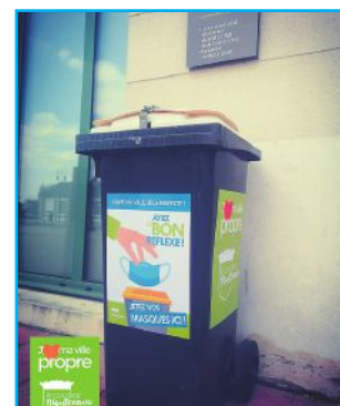
Les poubelles sont placées dans toute la ville.

La campagne de la municipalité pour une ville propre se poursuit au Coudray-Montceaux avec la mise à disposition de poubelles (un peu partout dans la commune) spécifiquement dédiées aux masques usagés. Pour rappel, les masques chirurgicaux sont principalement composés de polypropylène "non tissé", c'est-à-dire en matière plastique. Conséquence, ils se révèlent particulièrement polluants pour la planète, puisqu'ils mettent jusqu'à 450 ans à se désagréger dans la nature. Outre