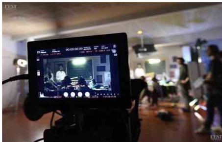
L'équipe de tournage était composée d'une vingtaine d'étudiants du Conservatoire libre du cinéma français (CLCF).