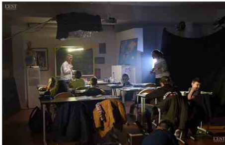
Une salle de cours reconstituée au collège Prévert avec des élèves transformés en morts-vivants.